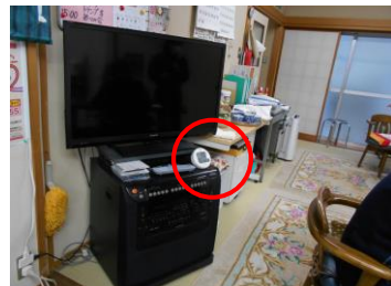
(二酸化炭素センサー 8台)

本部、支部(事務所)、福祉事務所(事務所、デイサービス、会議室)に設置。密になりやすい場所に設置し数値の可視化とアラームで適宜換気を促す。